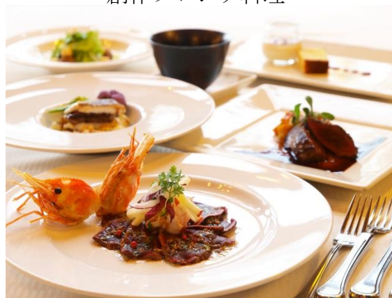
創作フレンチ料理