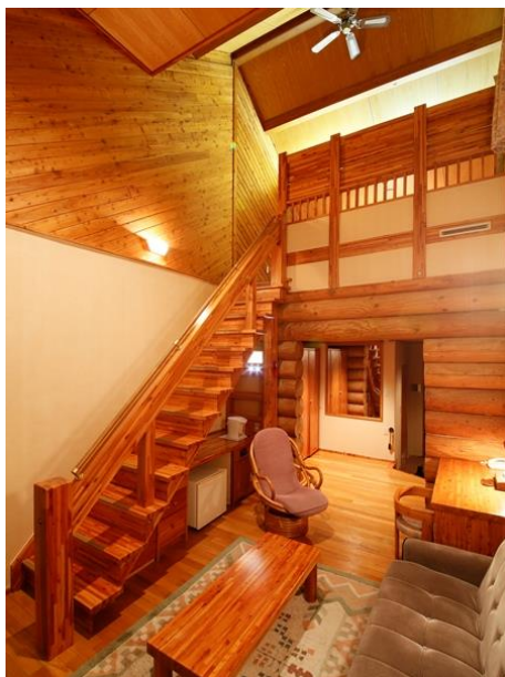
本館 客室 ツインルーム