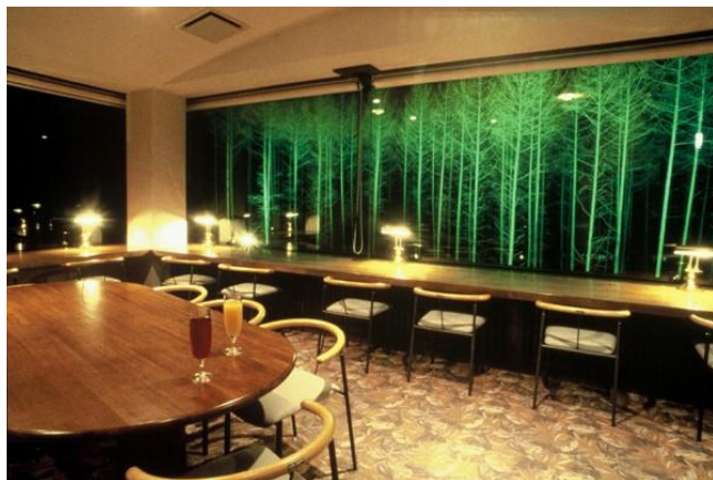
ラウンジ (パーティールーム)